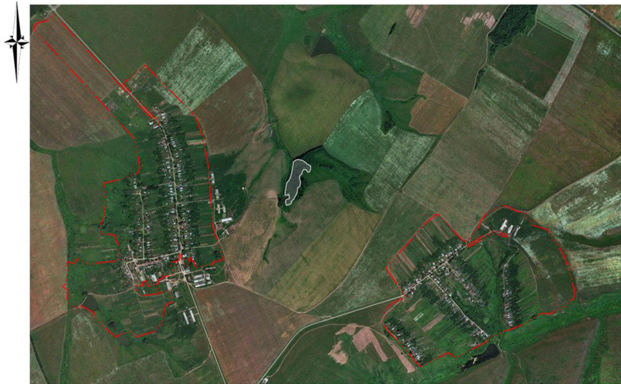
СХЕМА ГРАНИЦ ПАМЯТНИКА ПРИРОДЫ РЕГИОНАЛЬНОГО ЗНАЧЕНИЯ "ЛИПОВАЯ РОЩА У С. ТАТАРСКОЕ"